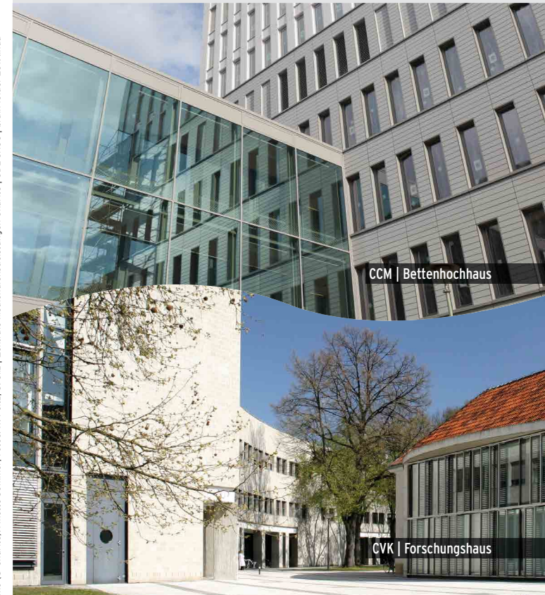
Layout & Lagepläne © Charité; A nette Sommer; Fotos: W. Peitz; U. Silz | Zentrale Medienstiftungen Charité | GDL-CHSC | brain folder 2019.indd

23. - 24. März | 25. - 26. Mai 7. - 8. September | 9. - 10. November